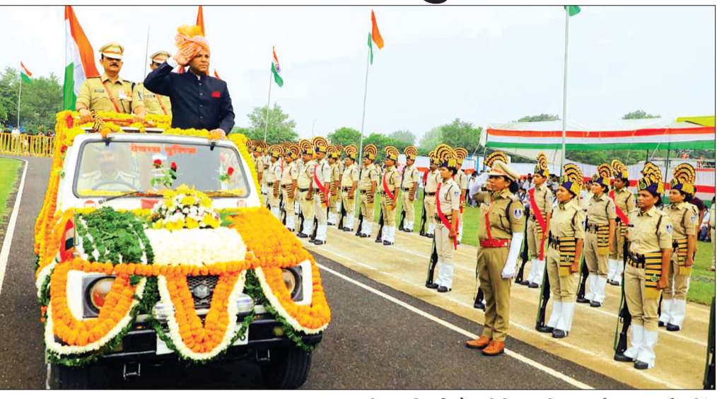
जिले के सभी शासकीय और अशासकीय संस्थाओं पर हुआ ध्वजारोहण, स्कूली बच्चों ने निकाली प्रभातफेरी