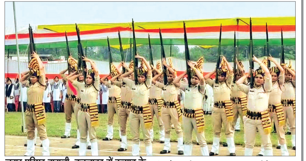
नगर परिषद बागली, करनावद में उत्साह के साथ मनाया गया स्वतंत्रता दिवस

भौरासा। नगर भर में बड़े ही गरिमापूर्ण और हर्षोल्लास के साथ देश का 79 वां स्वाधीनता दिवस मनाया गया। इस अवसर पर नगर के सभी नागरिकों ने एक दूसरे को स्वतंत्रता दिवस की बधाई दी और मिठाई बांटी। जहां एक ओर नगर के प्रमुख