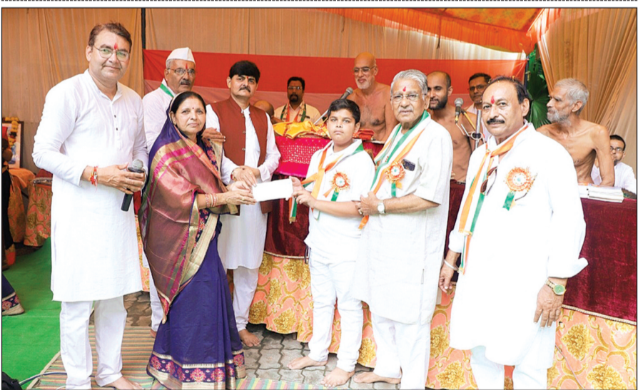
हरिभूमि न्यूज ललितपुर

दिगांबर जैन अटा मंदिर से श्री सुधा सागर कन्या इंटर कॉलेज तक प्रभात फेरी निकाली गई, प्रभात फेरी के पहुंचने पर दिगांबर जैन पंचायत समिति के पदाधिकारियों द्वारा ध्वजारोहण किया गया।